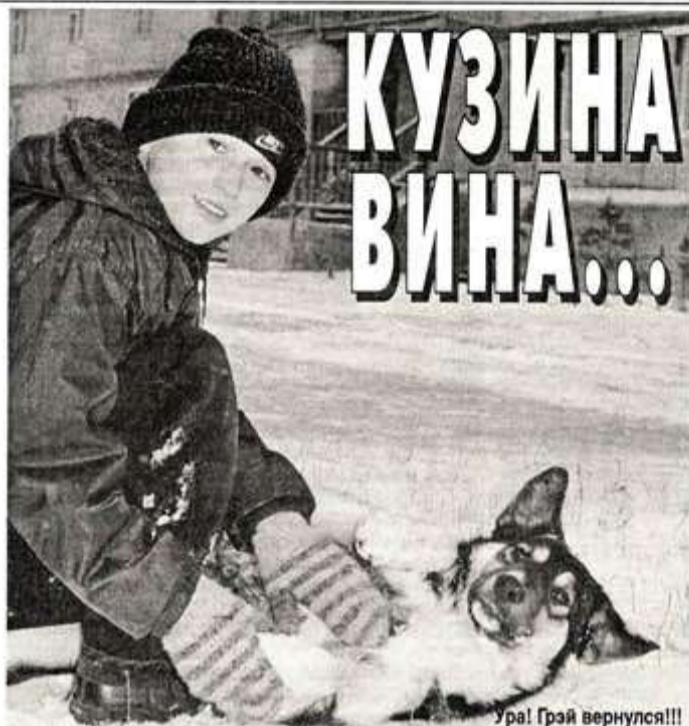
Ура! Грей вернулся!!!

Их много было той зимой - целых пять здоровенных, толстых, добродушных щенят. Кузя принесла, иссиня-черная собака, то ли овчарка, то ли ризеншнауцер. Помесь, в общем. А они все - как на подбор, походили на овчарок, взяли "овчарочки" гены матери. И отца, которого подрастающие щенки в глаза не видели. Зачем он им? В подвале тепло, сухо, материнского молока на всех хватает. Дворовая ребятишка, обнаружив логово, оборудовала им жилище по всем правилам: ящиками обгородила, тряпье