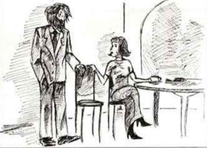
Рисунок С. СУХАНОВА