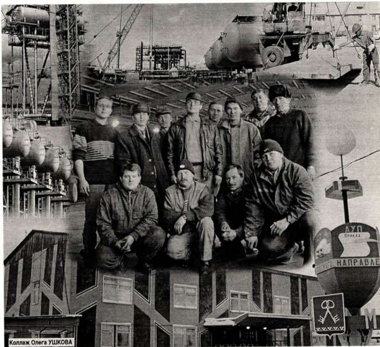
Коллаж Олега УШКОВА