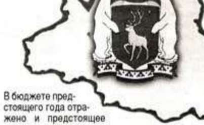
В бюджете предстоящего года отражено и предстоящее

Расходы, имеющие социальную направленность, превысят 69 процентов. В проекте бюджета предусмотрено индексация расходов на содержание учреждений социально-культурной сферы. Рост расходов будет свя-