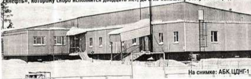
На снимке: АБК ЦДНГ-1

да в разработку Суторминского и Муравленковского месторождений. И тогда, говоря НГДУ, подразумевали ЦДНГ-1, а говоря ЦДНГ — НГДУ.