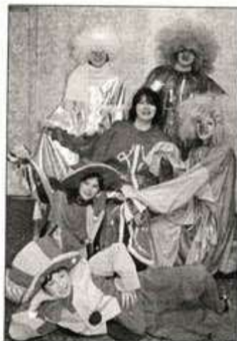
Здесь ждут. Стоит отметить, что знания и умения в центре дети приобретают бесплатно. Они сами выбирают направление деятельности, есть у них возможность вы-