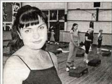
Красота женщины зависит не только от красоты лица, но и от красоты ее тела, чем больше женщина нравится себе в зеркале, тем выше