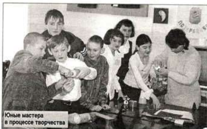
Юные мастера в процессе творчества

ной технике, украшают стены, на полочках - красочные сувениры из глины и алебаstra, изделия из проволоки и природных материалов.