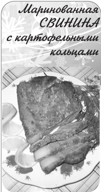
Маринованная СВИНИНА с картофельными кольцами

В эмалированную кастрюлю кладем мякоть свинины, лавровый лист, перец и нашинкованный кольцами лук. 1,5 стакана столового уксуса смешиваем с 1 стаканом оливкового масла, добавляем соль и сахар по вкусу. Заливаем этим маринадом мясо и ставим на сутки в прохладное место, перемешивая свинину, чтобы она равномерно промариновалась со всех сторон. Затем мясо выкладываем в глубокий противень, подлив немного маринада. Жарим в предварительно разогретой духовке, часто поливая выделяющимся соком. Когда мясо будет почти готово, слегка смазываем его горчицей и продолжаем жарить до готовности, не поливая соком, чтобы сверху образовалась румяная корочка. Готовую свинину нарезаем ломтиками и выкладываем на блюдо, полив его соком, а остальной сок подаем в соуснике.