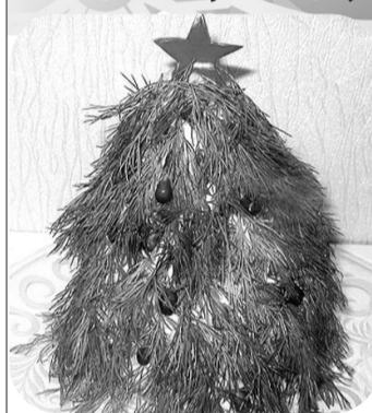
Салат «ЕЛОЧКА» (оливье)

Для приготовления салата нам потребуются: отварная куриная грудка (можно заменить отварной говядиной), зеленый горошек, майонез, консервированные огурчики и отварные картофель, яйца, морковь. Для украшения: укроп, клюква или гранат, красный болгарский перец.