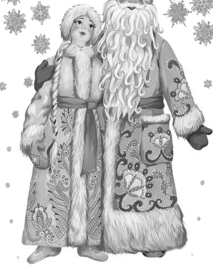
Торт «С НАСТУПАЮЩИМ!»

НОВЫЙ ГОД - самый яркий праздник. Он наполняет сердца людей предвкушением чуда. Традиции Нового года знакомы нам с детства. Это новогодняя елка, подарки и, конечно, праздничный стол со всевозможными угощениями. А еще это сказка с добрыми зимними волшебниками - Дедом Морозом и Снегурочкой, которые в преддверии Нового года делятся рецептами вкусных блюд с читателями нашей газеты.