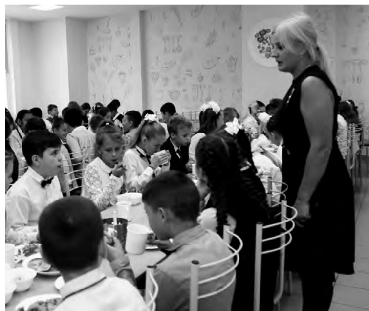
Шумные перемены и отсутствие свободных мест в столовых – так было раньше. В новом учебном году школьников ждут большие изменения