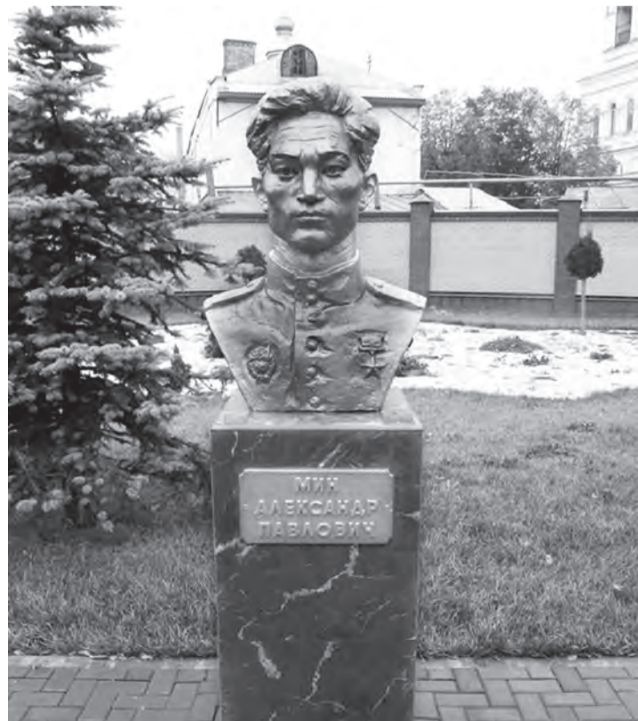
Бюст героя установлен в селе Бурыл Жамбылской (ранее Джамбульской) области Республики Казахстан