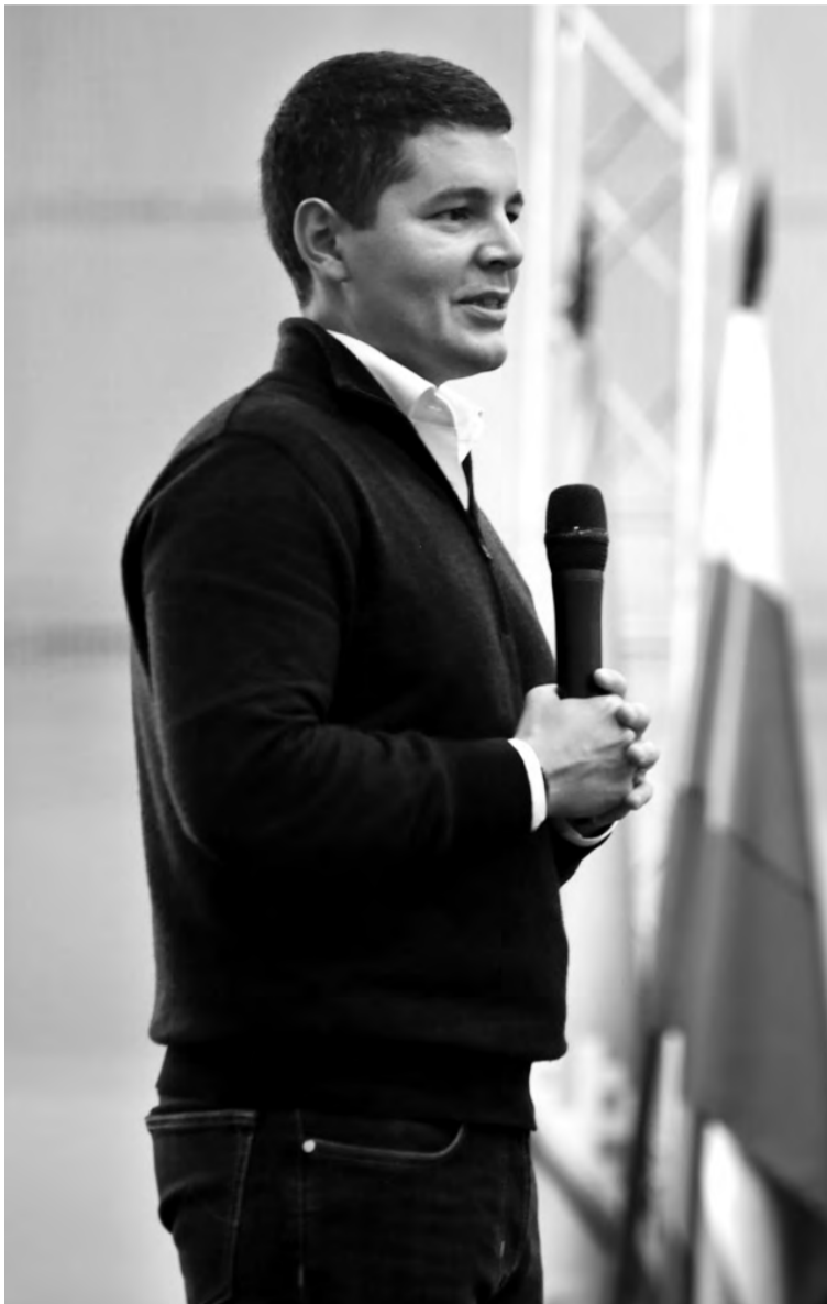
Дмитрий Артюхов общался с жителями города больше двух часов

Главное из встречи Дмитрия Артюхова с жителями Муравленко