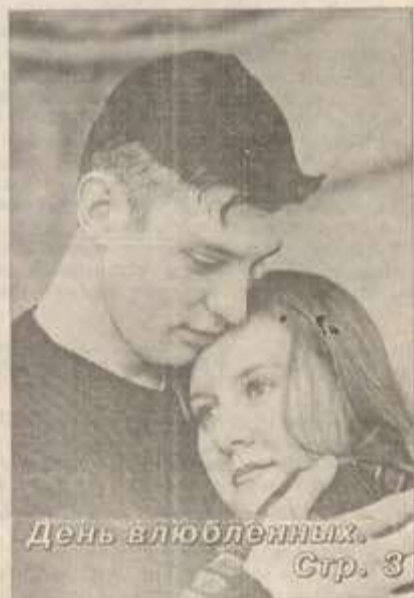
День влюбленных. Стр. 3