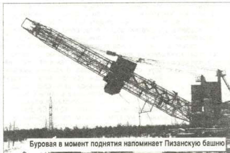
Буровая в момент поднятия напоминает Пизанскую башню