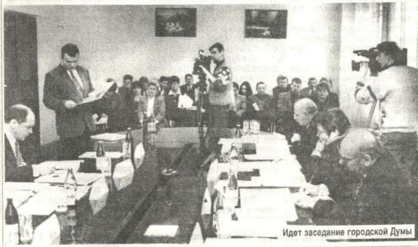
Идет заседание городской Думы