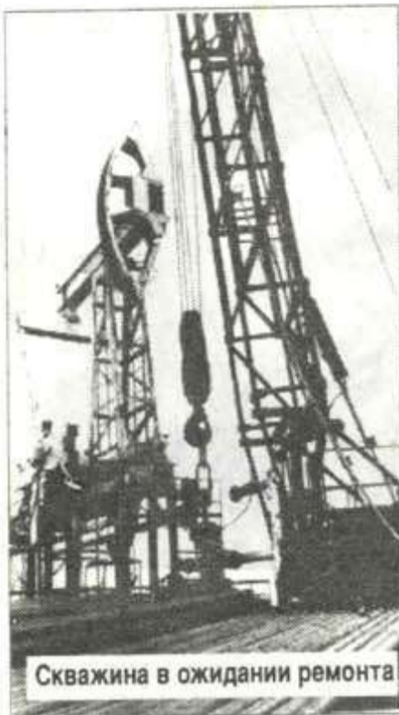
Скважина в ожидании ремонта

Даже в самые лютые морозы здесь всегда слякоть. Соляные растворы, которые тут готовят, неизбежно подтекая из емкостей машин, образуют мешанину из подтаявшего, рыхлого снега. Отсюда частички “осени”, необходимые для ремонта скважин, развозятся по всему Суторминскому месторождению.